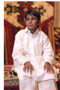
Iqbal: un eroe-bambino

Come tanti altri miei compagni, spero che questi bambini vengano liberati per far avere anche a loro la possibilità di vivere un'infanzia felice, serena e piena d'amore.