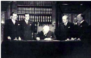
Enrico De Nicola ed Alcide De Gasperi firmano la Costituzione 22 dicembre 1947

La Costituzione è l'insieme di principi, valori e regole che ha dato vita ad un determinato ordinamento giuridico. Nel '900 le Costituzioni hanno avuto l'obiettivo di fissare i valori e i principi nei quali la nuova comunità si riconosce ed anche di definire puntualmente le regole di distribuzione dei poteri dello Stato, le garanzie per i cittadini riguardo al rispetto dei valori e delle nor-