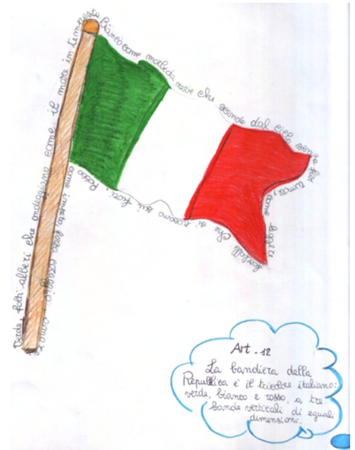
Uguaglianza, ancora da attuare totalmente!

"Tutti i cittadini hanno pari dignità sociale e sono eguali davanti alla legge, senza distinzione di sesso, di razza, di lingua, di religione, di opinioni politiche, di condizioni personali e sociali ...".